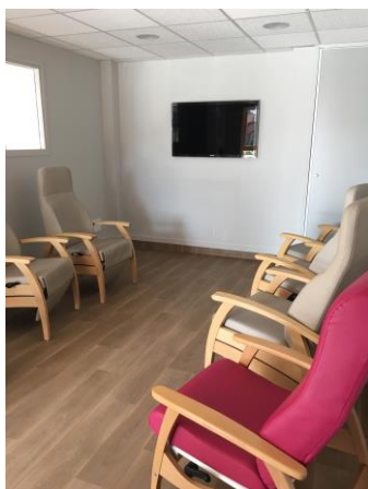
Salon de repos