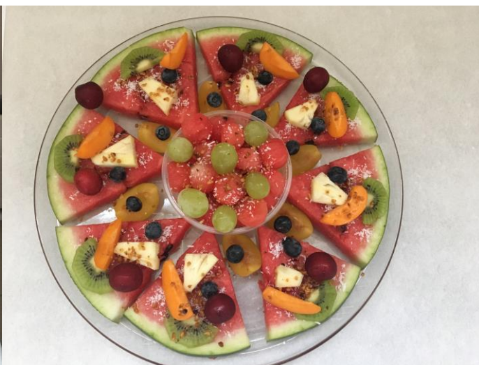
Atelier cuisine d'été