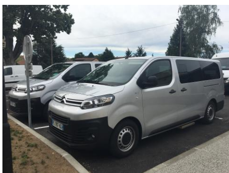
Véhicules pour le transport des personnes accueillies